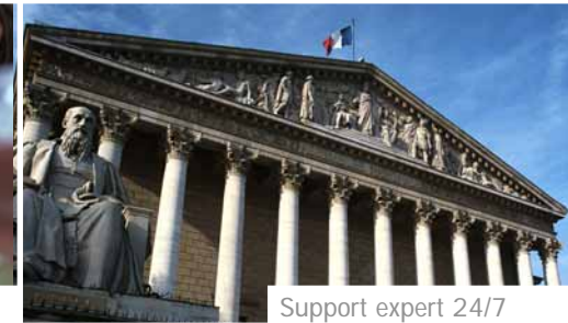
Support expert 24/7