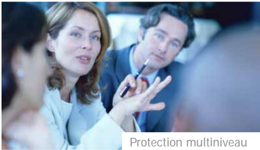
Protection mult niveau